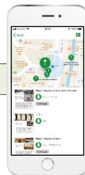
位置情報から選択