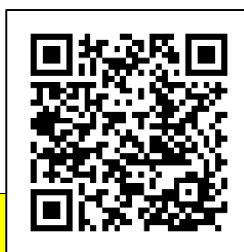
QRコードサンプル (スマホカメラで お試しください)